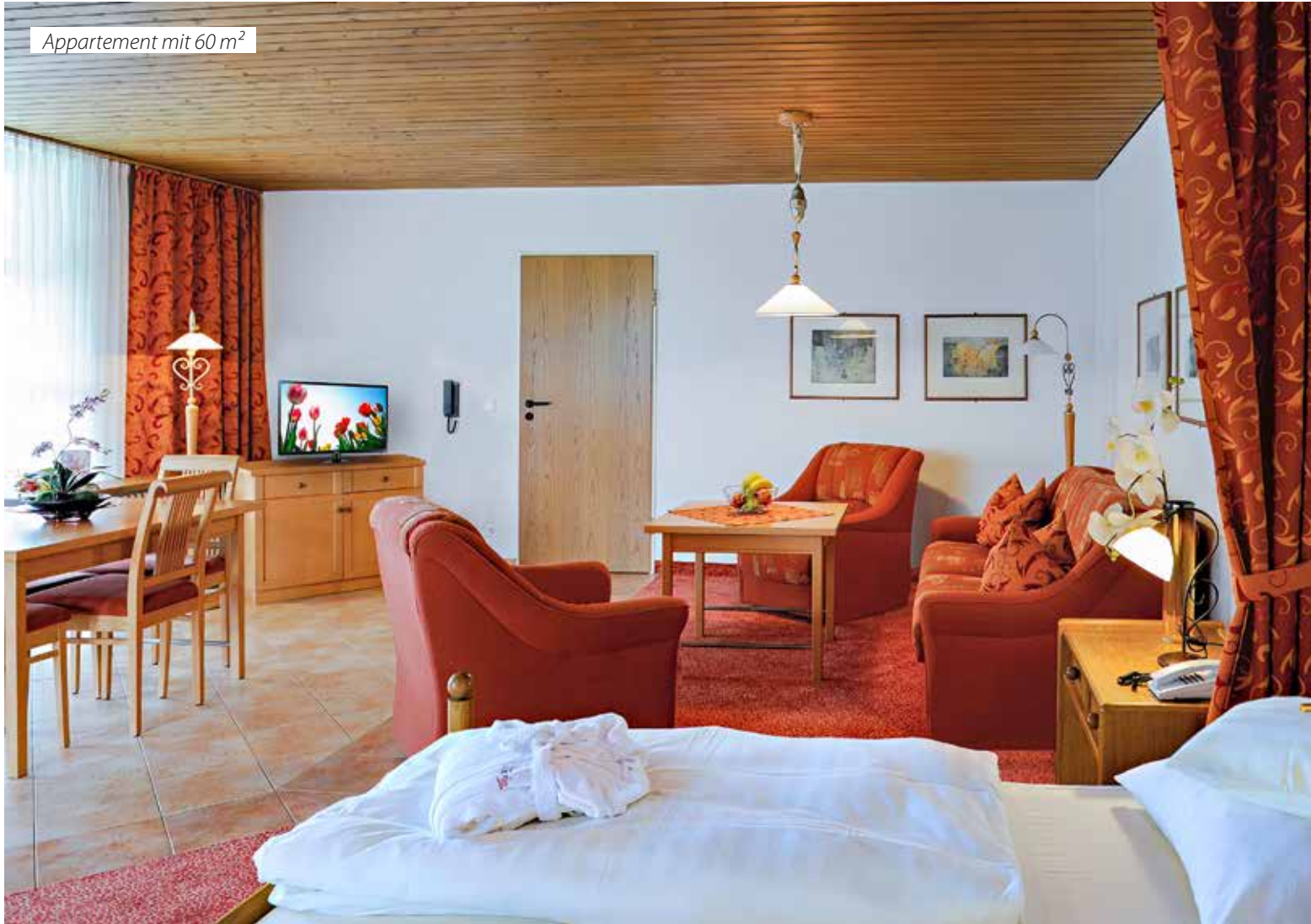
Appartement mit 60 m 2

Im Appartementhaus an der Poseidontherme laden acht großzügig angelegte Galerie-Appartements mit 40 m 2 sowie ein komfortabel eingerichtetes Appartement mit ca. 60 m 2 zum Entspannen ein! Alle Appartements bieten jede Menge Platz zum Wohlfühlen und Erholen – ideal auch für den Familien-Urlaub!