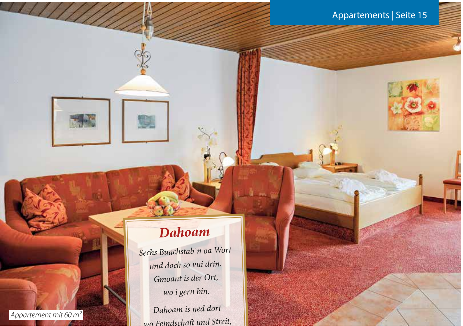
Appartement mit 60 m 2