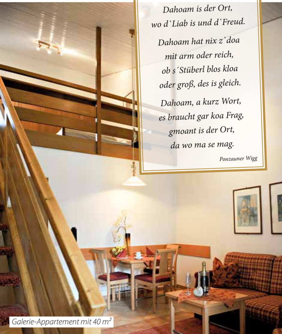
Galerie-Appartement mit 40 m 2